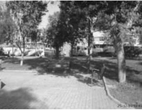
Şekil 2.3. Uğur Mumcu Parkından Bir Görünüş (Orijinal, 2004).