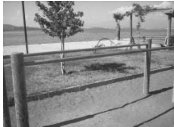
Şekil 2.5. Alparslan Türkeş Parkından Bir Görünüş (Orijinal, 2004).

Rekreasyonel kalite üzerine kurgulanmış mekân yeterliliğini ortaya koymak için belirlenen kriterlerin seçiminde daha önceki çalışmalar ve alan özellikleri etkin olmuştur. Bu doğrultuda Hepcan vd. (2001) tarafından kentsel dış mekânlarda kalitenin yeterliği üzerinde Kemalpaşa-İzmir örneğinde ortaya konulan yöntem esas alınmıştır.