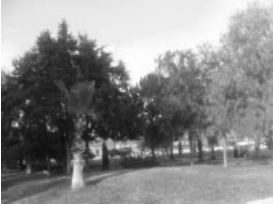
Şekil 2.6. Şehit Fethi Bey Parkından Bir Görünüş (Orijinal, 2004).

4 adet araştırma mekanı (Çizelge 2.1) kalitesi; yaşam konforu, psikolojik uygunluk ve erişebilirlik ölçütleri altında irdelenmiş, bu ölçütlere ilişkin olumlu ve olumsuz yeterlilik sayısal değerlerle ifade edilmiştir.