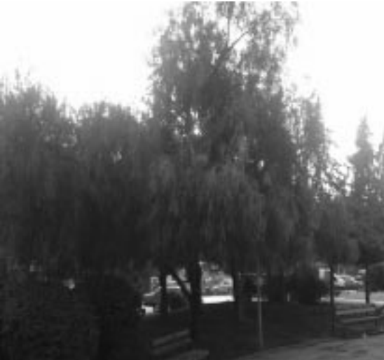
Şekil 2.4. Atatürk Parkından Bir Görünüş (Orijinal, 2004).

Araştırmanın ana materyalini; Fethiye kentsel yerleşimi içinde kentsel dış mekan olarak bilinen kamusal alan niteliği taşıyan park tipolojileri kapsamında 4 adet kent parkı