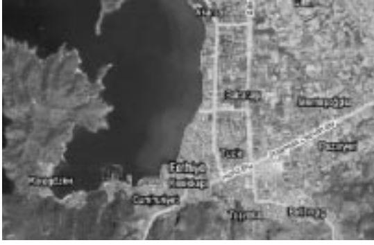
Şekil 2.2. Araştırmada Seçilmiş Kent Parkları (A:Şehit Fethi Bey Parkı, B:Atatürk Parkı, C:Uğur Mumcu Parkı, D:Alparslan Türkeş Parkı) ( http://www.earth.google.com )